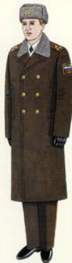
Парадная для строев и вне строев