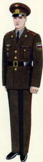
Повседневная для строев