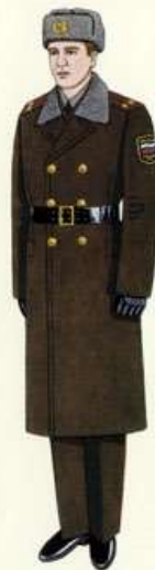
Повседневная для строев