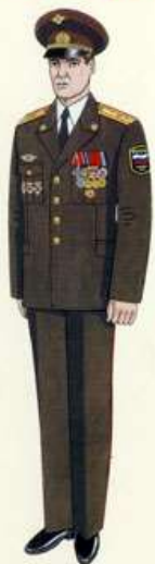
Парадная для строев и вне строев